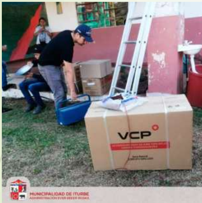
Donación de Aires Acondicionados a Instituciones Educativas