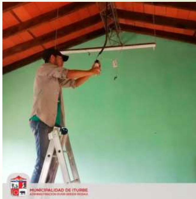
Refacción y reparación de sistema de iluminación de escuelas