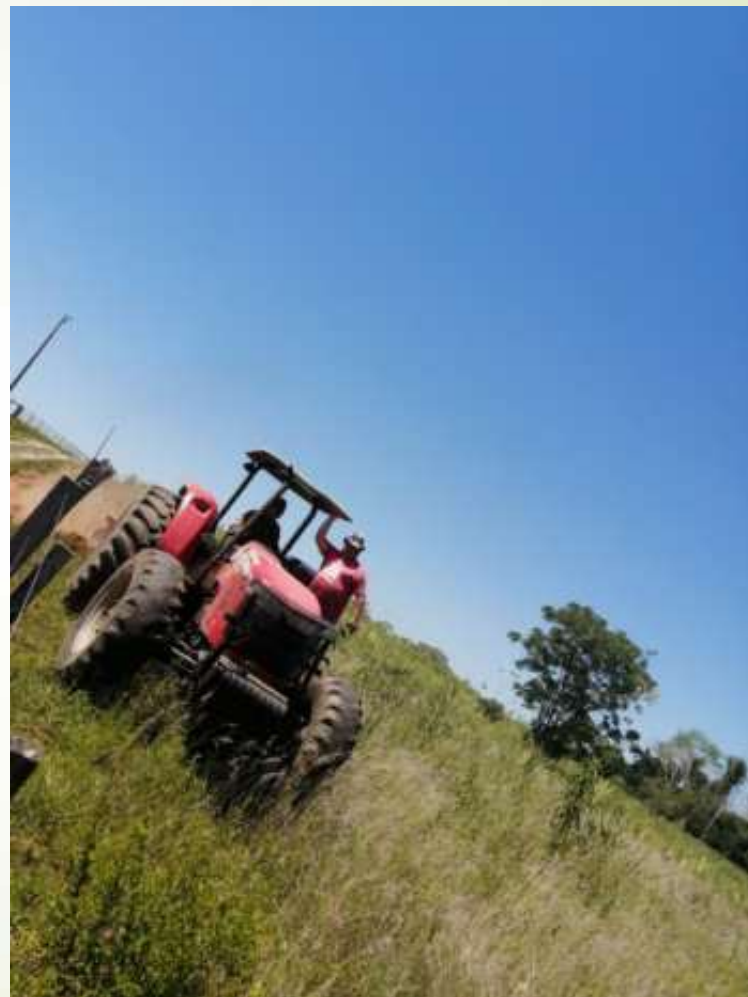
Preparación de suelo