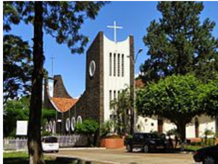
Iglesia Catedral "San Blas".

La densidad poblacional en esta región y en especial Ciudad del Este está conformada por un sector importante de extranjeros, más concretamente por árabes, chinos, coreanos, japoneses y brasileños. El distrito es totalmente urbano.