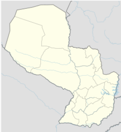
Ciudad del Este