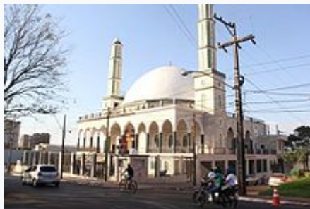
Mezquita "Al-Rashdeen" de la Ciudad, la más grande del país.

La mayor parte de la población profesa la Rama católica de la religión cristiana, seguida por las demás ramas cristianas como el protestantismo, además la ciudad tiene una fuerte presencia islámica con varios templos dedicados a esa religión.