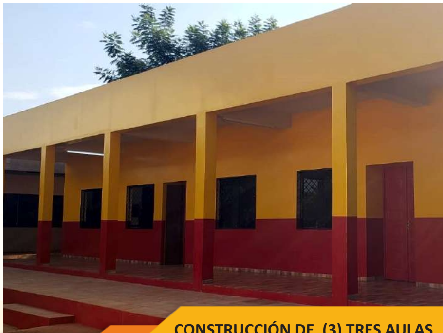
CONSTRUCCIÓN DE (3) TRES AULAS ESC. BÁSICA N° 1325 SANTA R. DEL MONDAY