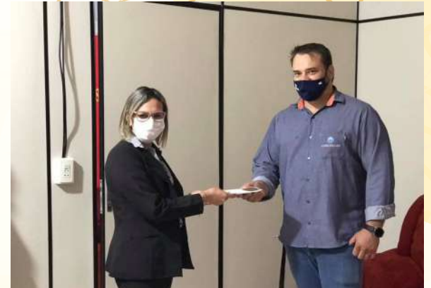
Aporte para lava manos IPPA