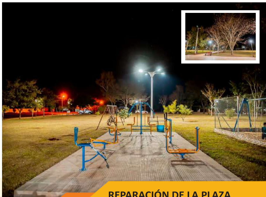
REPARACIÓN DE LA PLAZA CURUPAYTY