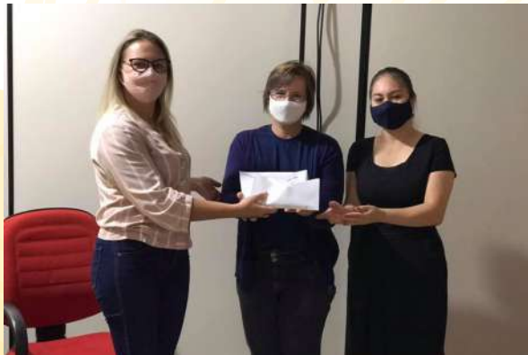
Aporte al Ballet Municipal