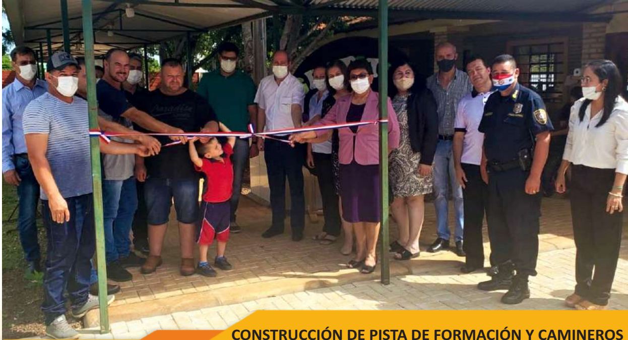
CONSTRUCCIÓN DE PISTA DE FORMACIÓN Y CAMINEROS ESC. BÁSICA Nº 1917 "SAN JOSÉ" - CURUPAYTY