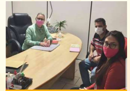
Aporte Progreso B° Guaraní y Iglesia Asamblea de Dios