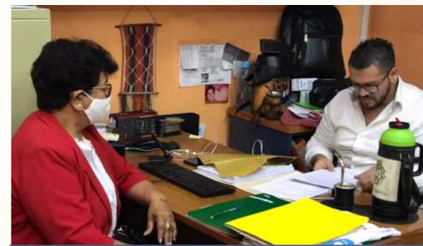
Oficina de Catastro