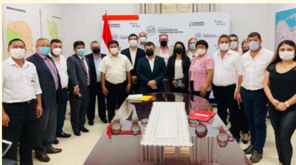
Reunión con Ministro de Educación y Ciencias