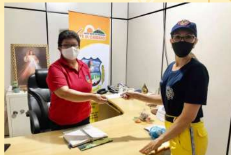
Aporte Cuerpo de bomberos