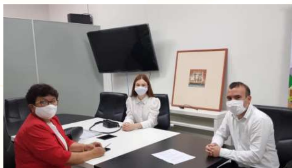
Capacitación Sistema SICCA