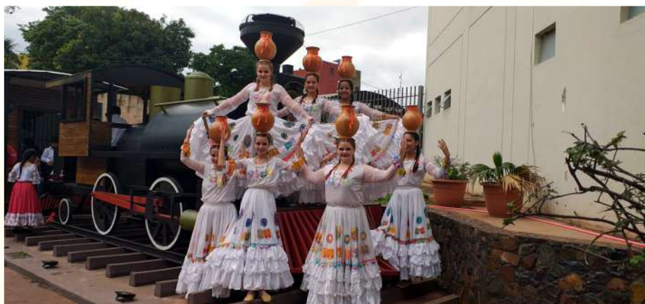
Elenco del Ballet Municipal