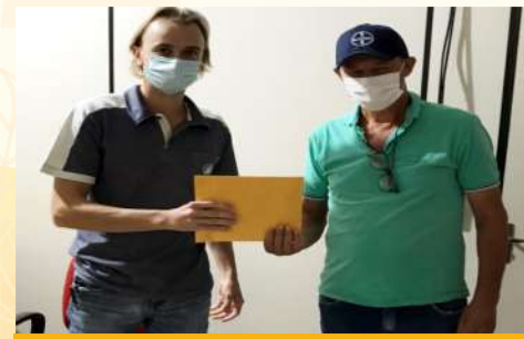
Aporte comisión de Medio Ambiente