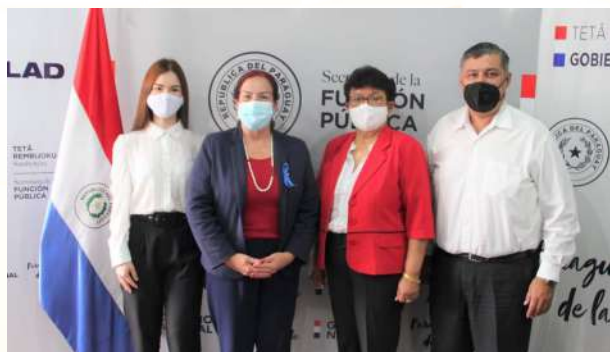
Ministerio de la Función Pública del Paraguay

Importantes Gestiones realizadas por la Intendente Municipal en la capital del país, en los diferentes Ministerios para el beneficio de nuestro Municipio.