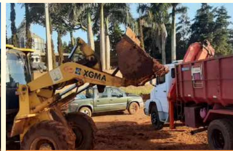
Limpieza y reparaciones