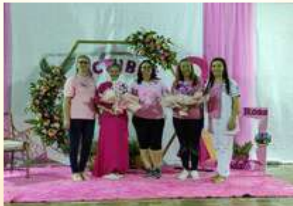
Charla y Caminata por Octubre Rosa

Un Paso muy importante para nuestra ciudad es la visita del Ministerio de la Mujer, a través del Viceministerio de Igualdad y no Discriminación, Quienes realizaron jornadas de capacitación y atención médica a mujeres de la comunidad.