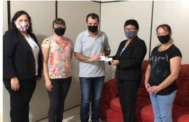
Aporte al Consejo local de Salud Santa Rosa del Monday y Curupayty