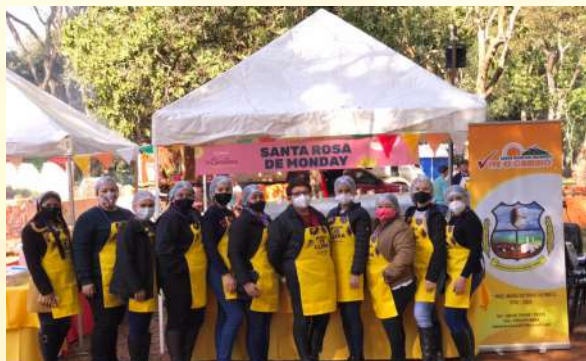
Participación Voluntaria en TELETON

seguimos avocados en impulsar la actividad económica de los pequeños productores de Santa Rosa del Monday, para el auto consumo y a la vez para la comercialización en ferias de productores de la región. Cabe destacar que la agricultura en nuestra región es de suma importancia para el crecimiento sostenible de la economía local. los pequeños y medianos productores serán siempre un eje central para el apoyo de la municipalidad.