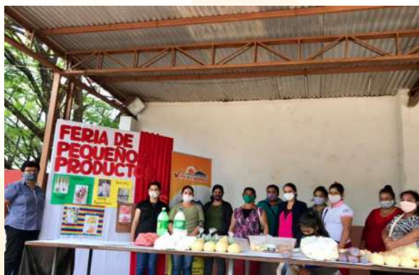
Feria de Pequeño Productor