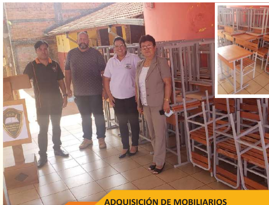
ADQUISIÓN DE MOBILIARIOS ESC. Y COL. NAC. CARLOS A. LÓPEZ Y ESC. BÁSICA N° 1325