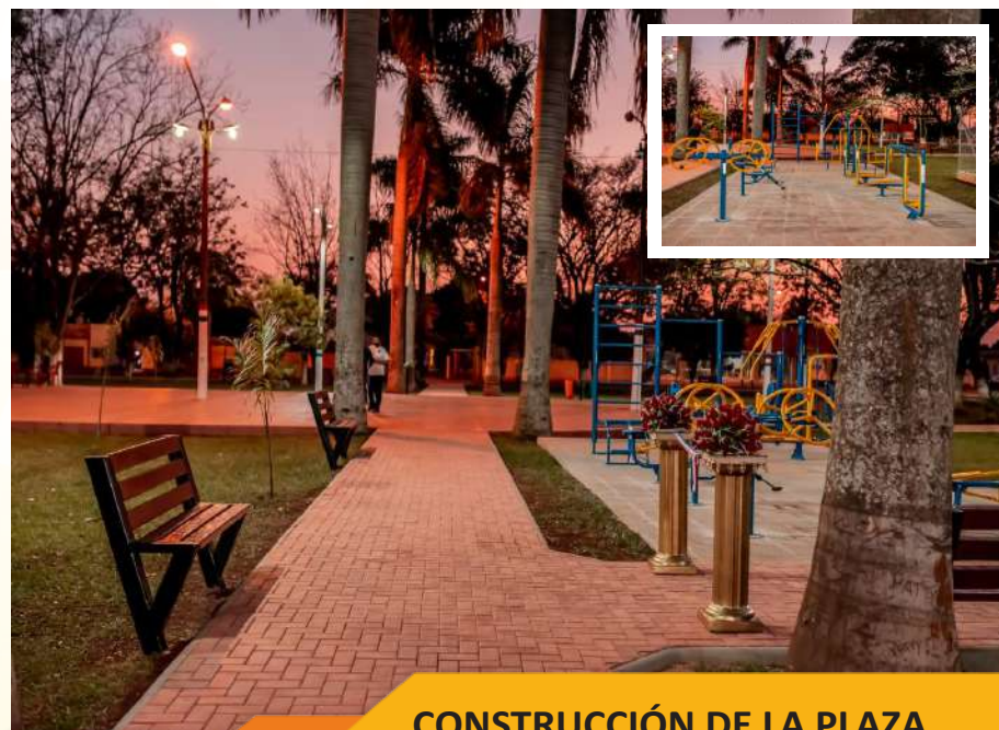
CONSTRUCCIÓN DE LA PLAZA CENTRAL DE SANTA ROSA