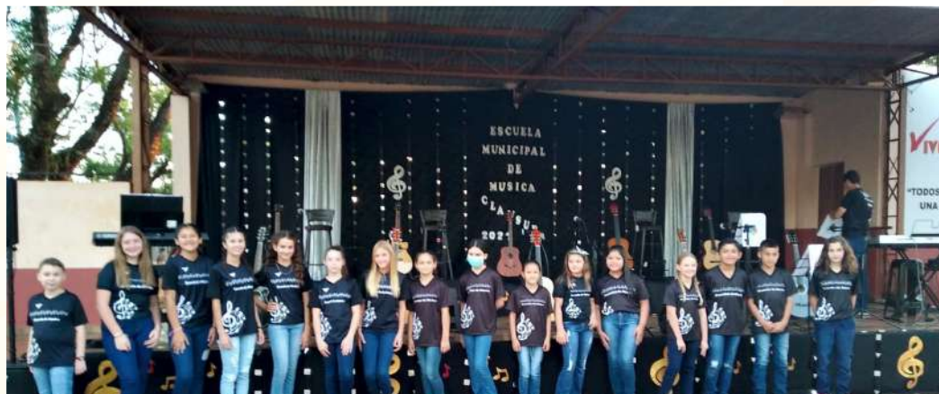
Escuela Municipal de Música