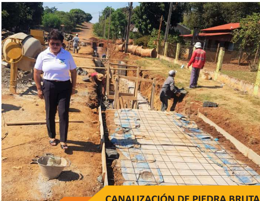
CANALIZACIÓN DE PIEDRA BRUTA COLOCADA CON TAPA DE Hº Aº