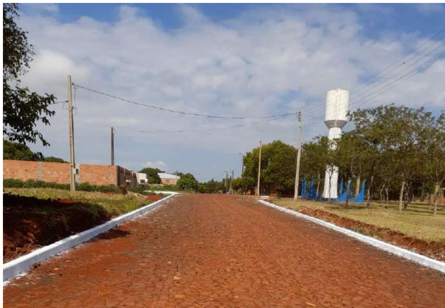
CONSTRUCCIÓN DE EMPEDRADO Barrio Portal