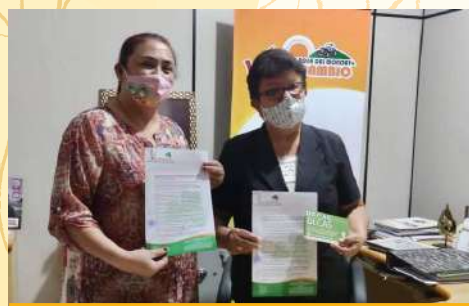
Convenio de Becas- Instituto Superior en Ciencias de la Salud San Patricio de Irlanda del Norte