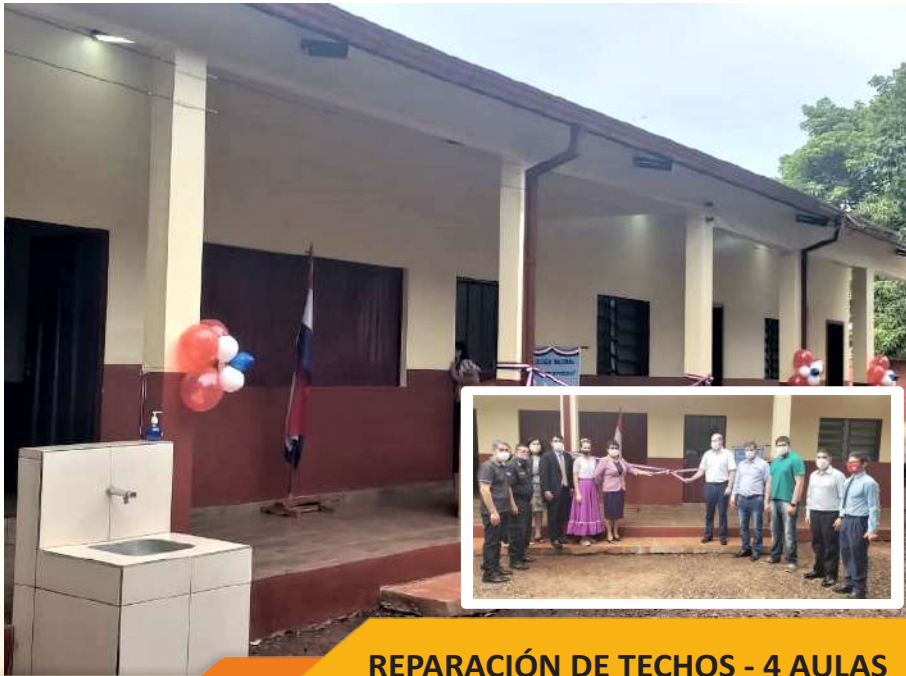
REPARACIÓN DE TECHOS - 4 AULAS COL. NAC. GRAL. E. DIAZ