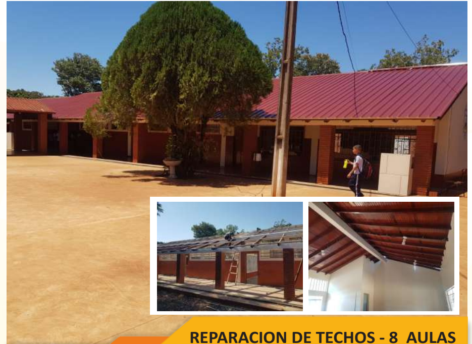
REPARACION DE TECHOS - 8 AULAS ESC. Y COL. NAC. CARLOS A. LÓPEZ