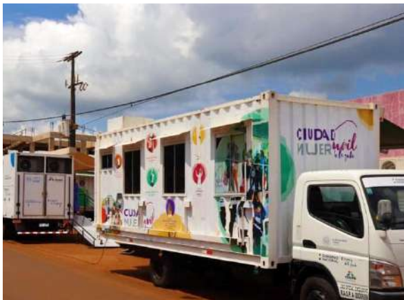
Atención médica a través de la Ciudad Mujer Móvil