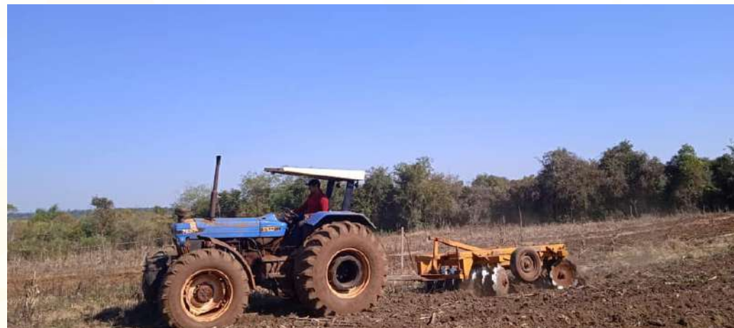
Rastroneada en distintas localidades