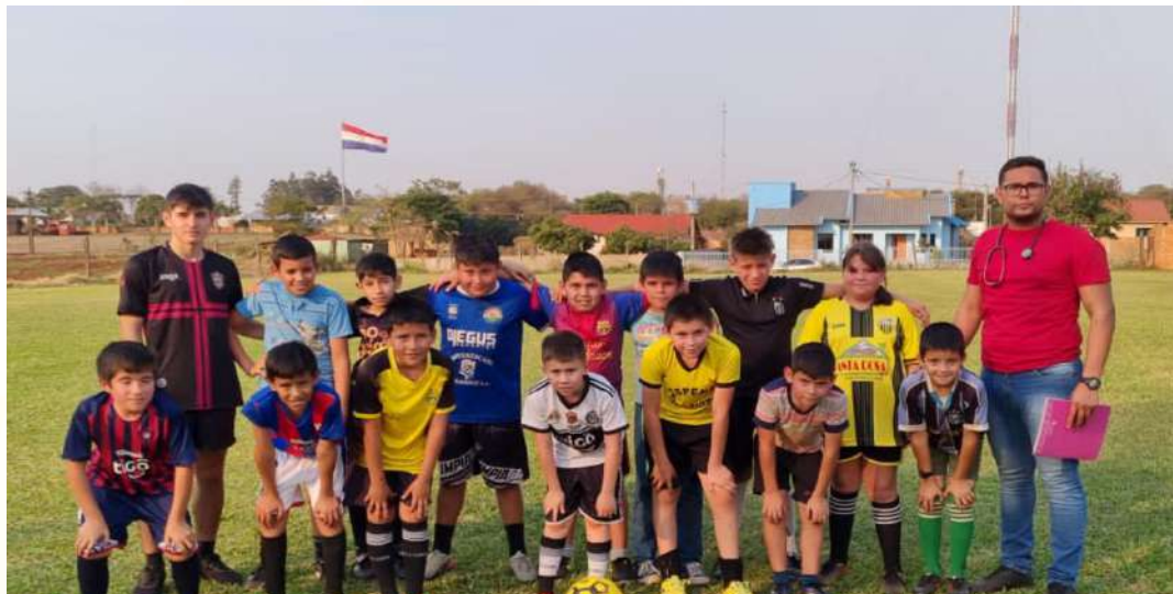
Escuela de Fútbol Municipal

Cabe destacar que el deporte eleva También el bienestar y la calidad de vida de la sociedad por los efectos beneficiosos de la actividad física, tanto para la salud corporal como para la salud emocional, desde la municipalidad de Santa Rosa del Monday Impulsamos y apoyamos las prácticas deportivas y otras actividades no sedentarias que con regularidad desembocan a que los ciudadanos se encuentren más satisfechos y experimenten un mayor bienestar .