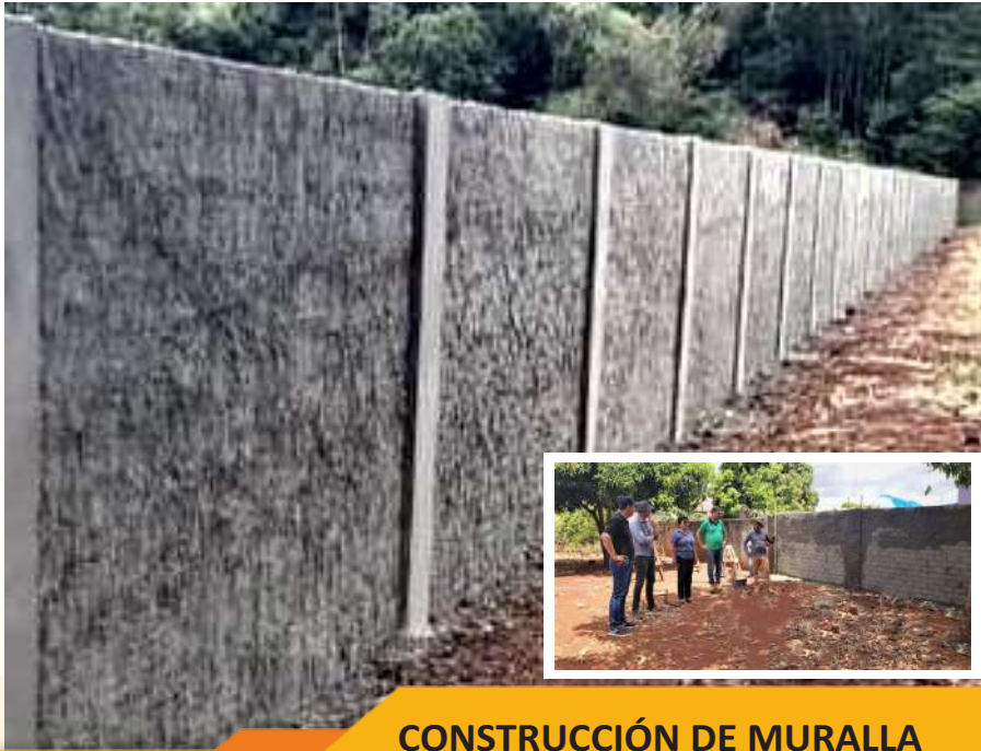
CONSTRUCCIÓN DE MURALLA ESC. Y COL. NAC. CARLOS A. LÓPEZ