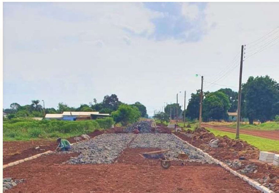
CONSTRUCCIÓN DE EMPEDRADO Curupaty - Costado Iglesia Católica