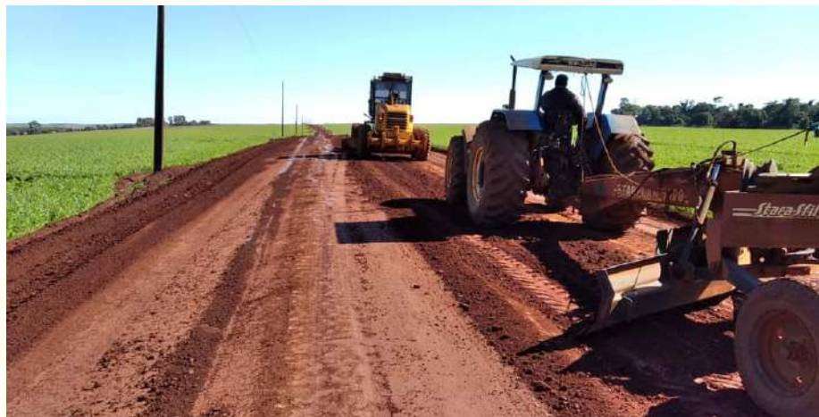
Reparación de caminos a distinta comunidades

El departamento de obras realizan frecuentemente reparación y mantenimiento de caminos vecinales en distintas comunidades de Santa Rosa del Monday, destacamos el apoyo constante de los agricultores de los municipios.